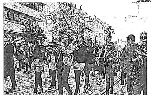
La Niña María recorrió la calle Real hasta la Iglesia Mayor Parroquial.