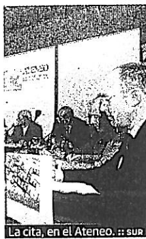
La cita, en el Ateneo. SUR

mesa redonda que se celebró el pasado jueves en el Ateneo de Málaga. Bajo el lema 'Educación financiera para la ciudadanía: necesidades y retos', nueve expertos de diferentes ámbitos y elevado nivel discutieron sobre cómo elevar el nivel de conocimientos económicos y financieros de los ciudadanos con el fin de evitar situaciones de sobreendeudamiento o abusos. Unicaja, que está impulsando el proyecto de educación financiera Edufnet, fue uno de los participantes.